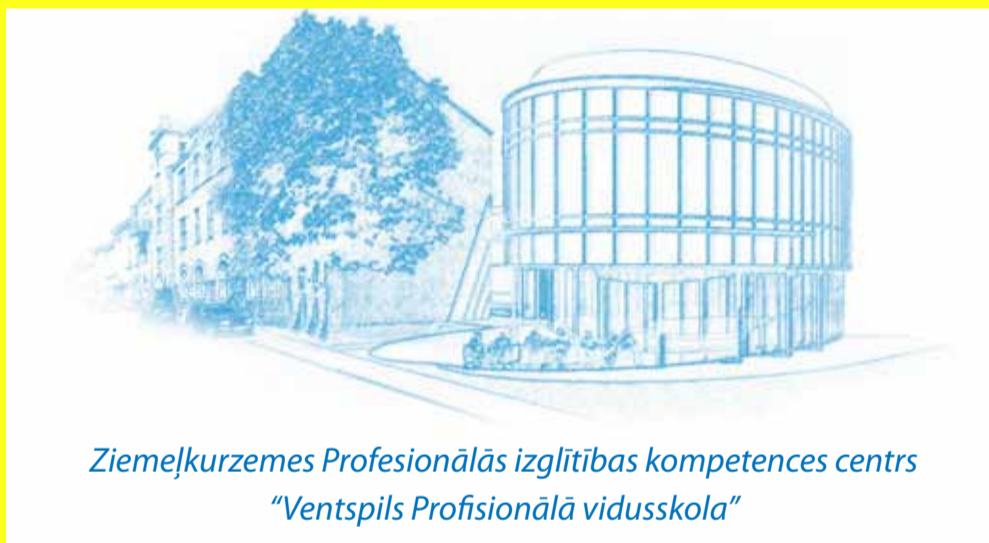
Ziemeļkurzemes Profesionālās izglītības kompetences centrs “Ventspils Profesionālā vidusskola”

pieprasījuma pieaugumu paredz mazāk kā 5 % darba devēju. Vairāk kā puse – 56 % – Kurzemes plānošanas reģiona uzņēmēju novērtē, ka viņiem bijis grūti atrast un piesaistīt nepieciešamos profesionālās izglītības iestādēs sagatavotos speciālistus kā darbiniekus, pie tam 12 % apgalvo, ka tas bijis pat ļoti grūti. Te gan jāpiemin, ka iemesli tam ir bijuši ļoti dažādi, piemēram, zems atalgojums, ģeogrāfiski neērta uzņēmuma atrašanās vieta vai arī uzņēmums meklē ļoti plaša